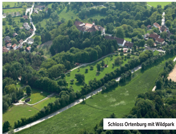
Schloss Ortenburg mit Wildpark

Mitglieder erhalten übrigens ermäßigten Eintritt in den Wild- und Vogelpark sowie zu verschiedenen Veranstaltungen der Ortenburger Schlosskultur.